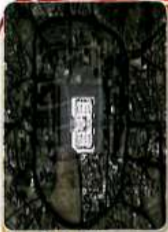
صورة جوية للمدينة النبوية