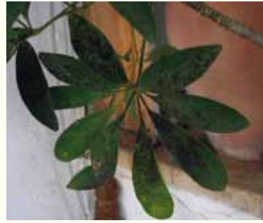
ينمو العفن الأسود لوجود إصابة بالمن

الحشرة في أشهر الربيع والصيف بسبب ارتفاع درجة الحرارة. ينجم الضرر عن هذه الحشرات من امتصاص العصارة النباتية بأجزاء فيها الماصة الثاقبة. تتغذى على عصارة النبات وقد ينقل فيروسات نباتية أثناء عملية التغذية. تشمل أعراض الإصابة انخفاضاً في قوة نمو النبات وأوراقاً مشوهة. تفرز المن نفايات سكرية مما يسهل نمو العفن الأسود وظهور النمل.